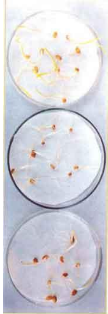
الصورة رقم (٢): نمو بذور القمح

مع العلم أن مكان التخزين كان عاديا ولم يراع فيه أي شروط الحرارة أو الرطوبة أو ما إلى ذلك . وفي هذا الإطار تبين أن البذور التي تركناها في سنابلها فقدت كمية مهمة من الماء وأصبحت جافة مع مرور الوقت بالمقارنة مع البذور المعزولة من سنابلها ، وهذا يعني أن نسبة ٢٠.٣% من وزن القمح المجرد من سنبله مكون من الماء مما يؤثر سلباً على مقدرة هذه البذور من ناحية زرعها ونموها ومن ناحية قدرتها الغذائية لأن وجود الماء يسهل من تعفنه وترديه صحي.