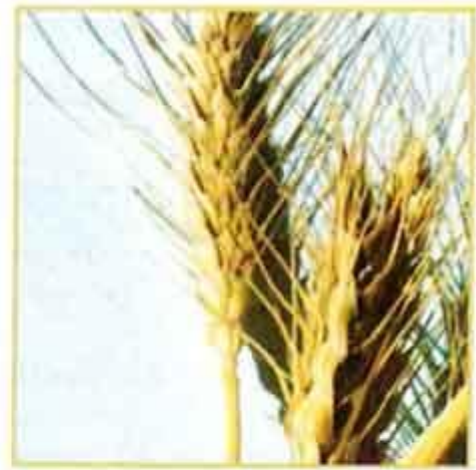
(أ) : مباشرة بعد الحصاد

الصورة رقم (١) : مقارنة بين سنابل مخزونة لمدة سنتين