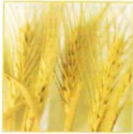
(ب) : بعد سنتين من التخزين

إن النمو الزراعي يستلزم بالأساس الزيادة في الإنتاج والاستغلال الأمثل والأنجح للمنتجات الزراعية. ويعد مفهوم تخزين البذور في السنابل ( حسب ما ورد في الآية السابقة ) نظاما أساسيا للحفاظ على الإنتاج في ظروف بيئية قاسية. وهذا ما يجمع بين الزراعة وتقنيات التخزين والحفاظ على المنتج ، كما يعد هذا التخزين نظاما ثقافيا تخوض بواسطته الجماعات البشرية معركة حقيقية لضمان إعادة اتباع استراتيجية متنوعة ( تقنية و سل